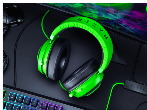
▲キャンペーン賞品「Razer Kraken Green」

本キャンペーンは開催期間中に新サーバー「フロンティア」にログインをされた方を対象に毎週抽選を行います。賞品のラインナップは、クリアで強力なサウンドのゲーミングヘッドセット「Razer Kraken Green」やゲーミングキーボード「Razer Ornata V2 JP」をはじめ、新サーバー「フロンティア」での新生活に役立つゲーム内アイテムをご用意しております。この機会に『アーケイジ』を新サーバー「フロンティア」でお楽しみください。