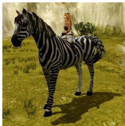
▲騎乗ペット「野生のシマウマ」

他にも称号やペット専用装備もプレゼントいたしますので、この機会にぜひ「新キャラクター先行作成キャンペーン」へご参加ください。