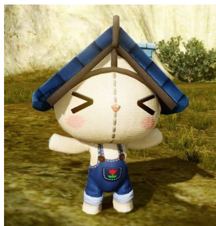
▲戦闘ペット「素朴な住宅ヌイグルミ型ペット」