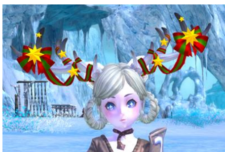
▲ルドルフの角(頭アバター)