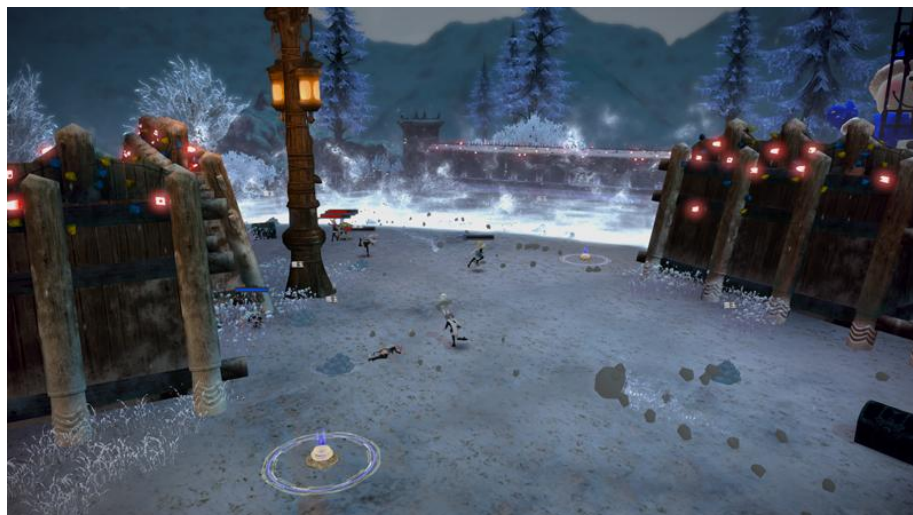
▲時間経過とともに狭くなる戦場と入り乱れる雪玉

雪合戦を楽しむだけで必ずもらえる「戦利品」を集めると、乗り物や消耗品、イベントシリーズのカードなど様々なアイテムと交換できます。「戦利品」は必ず獲得できますが、雪合戦に勝利するとより多く獲得できるので、同じチームのプレイヤーと勝利を目指してがんばってください。